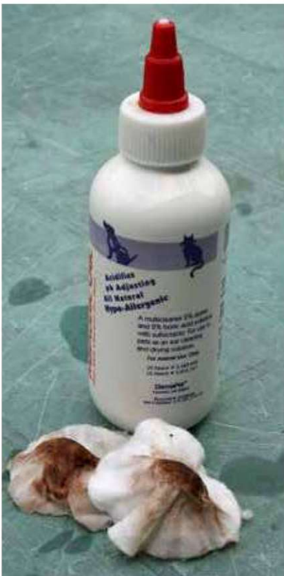
En god tommelfingerregel er å tukle minst mulig med rene, fine ører og være veldig lett på labben når du fjerner synlig ørevoks. Bruk myke bomullpads som fuktes med en mild ørerens. Har hunden din veldig mye ørevoks som raskt kommer igjen, bør du spørre dyrlegen om råd.