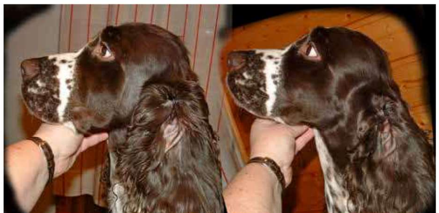
Gjør det til en vane å klippe pelsen på hals og rundt ørene minimum en gang i måneden. Når du klipper så ofte er jobben fort gjort.

Klipp først bort flokene der pelsen skal være kort. Øverste tredjedel eller halvdel på utsiden