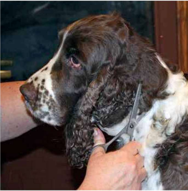
Vil du at hunden din skal se finest mulig ut bruker du tynnesaks og tynner overgangene mellom maskinklippet pels og uklippet pels.